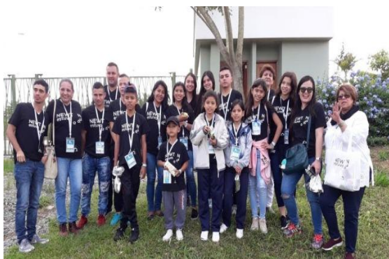
Encuentro de Ondas Caldas