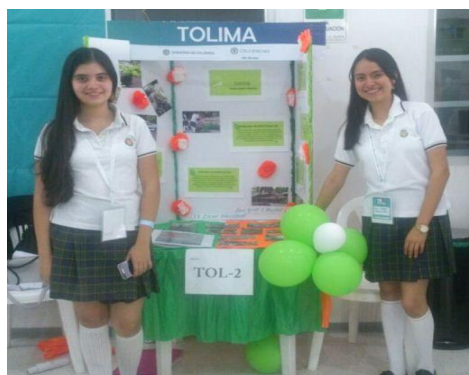
Encuentro de Ondas Tolima